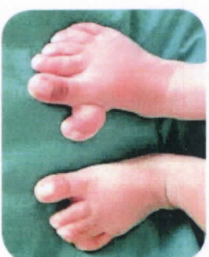
นิ้วเท้าติดกันหรือนิ้วเท้าเกิน