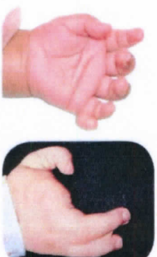
นิ้วมือเกิน หรือ นิ้วต้วน