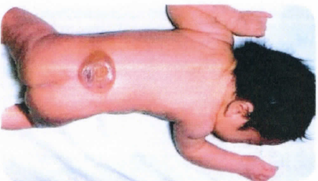
กระดูกสันหลังไม่ปิด