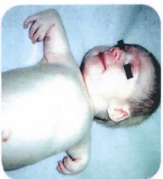
ความพิการของกระดูกแขน