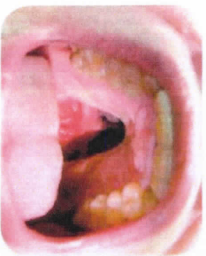
เพดานโหว่