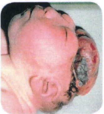
กะโหลกไม่ปิด